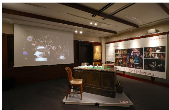
会場写真(昨年度開催の様子)

公益財団法人 ローム ミュージック ファンデーション(京都市)は、公益財団法人 京都市音楽芸術文化振興財団とともに主催する企画展「小澤征爾音楽塾展 2018」を開催いたします。