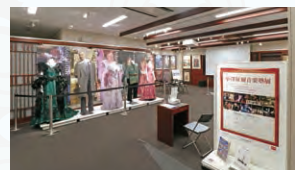
前回の小澤征爾音楽塾展の様子(2017.1月～3月)