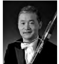
◎読売日本交響楽団

武蔵野音楽大学卒業後、1989年西ドイツ・ハノーファー音楽大学ソロクラスを卒業。伊達博、岡崎耕治、クラウス・トゥネマンの各氏に師事。1987年B.S.O.ユンゲ・ドイチェ・フィルハーモニー首席奏者。1989年にはベルギー王立フレッシュオペラ首席奏者として入団後、同年より読売日本交響楽団首席奏者として就任。読売日本交響楽団及び他楽団ソリストとして、また国内外著名アーティストとの共演多数。洗足学園音楽大学客員教授、武蔵野音楽大学、日本大学芸術学部各講師、宮崎国際音楽祭、木曾音楽祭などにレギュラー出演。サイトウ・キネン・オーケストラ首席奏者、ソニー国際オーボエコンクール、東京音楽コンクール審査員。