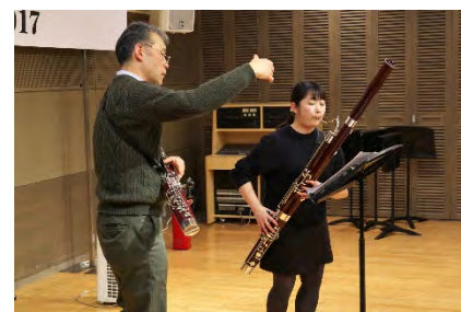
前回開催の管楽器セミナーの様相(2017年)

本件詳細は 募集チラシ、ローム ミュージック ファンデーション Web サイトをご覧ください。