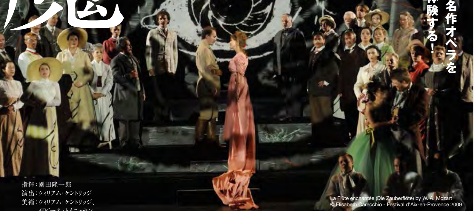
La Flûte enchantée (Die Zauberflöte) by W. A. Mozart © Elisabeth Carecchio - Festival d'Aix-en-Provence 2009

指揮：園田隆一郎 演出：ウィリアム・ケントリッジ 美術：ウィリアム・ケントリッジ、 ザビーネ・トイニッセン