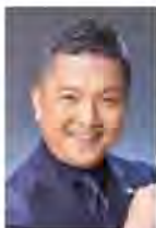
朝岡 聡 (ナビゲーター) Satoshi Asaoka

テレビ朝日アナウンサーとして活躍。フリーとなつてからはクラシックコンサートの司会や企画構成にも活動のフィールドを広げ、芸術ファンのすそ野を広げる司会者として注目と信頼を集めている。