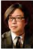
反田 恭平 (ピアノ) Kyohei Sorita 2014、2015年度奨学生

第81回日本音楽コンクール第1位入賞。チャイコフスキー記念国立モスクワ音楽院、現在はショパン音楽大学に在籍。2015年チャタ・ディ・カントウ国際ピアノ協奏曲コンクール古典部門優勝。デビューから3年、もっとも勢いのあるピアニストとして注目されている。