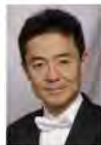
阪 哲朗 (指揮) Tetsuro Ban 1992、1993年度奨学生

京都生まれ。第44回バザンソン国際指揮者コンクール優勝他受賞多数。ドイツ・アイゼナハ歌劇場音楽総監督、ドイツ・レーゲンスブルク歌劇場音楽総監督などを歴任。国内外のオーケストラ、歌劇場に招かれ成功を取っている。