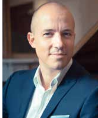
ジュリアン・ジェルネ(ピアノ)