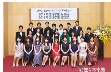
奨学生 認定式・報告会より (2018年8月開催)

ローム株式会社(本社:京都市)が支援する公益財団法人 ローム ミュージック ファンデーション(京都市)は、このたび、音楽文化の普及と発展のために毎年継続している、「音楽活動への助成と奨学援助」の2020年度分の募集を開始しました。1991年の財団設立から現在までに、音楽活動への助成を2,209件(約18億4,852万円)、奨学生480名(約28億6,181万円)に支援しています。