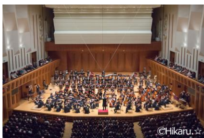
オーケストラ、オペラの公演 音楽大学オーケストラ・フェスティバル実行委員会 第8回 音楽大学フェスティバル・オーケストラ演奏会 (2019年3月30日開催)