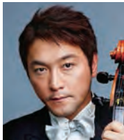
古川 展生 (チェロ) Nobuo Furukawa