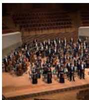
東京交響楽団 (管弦楽) Tokyo Symphony Orchestra

岡山市出身、ウィーン在住。ブ람ス国際コンクール、日本音楽コンクール優勝。ウィーン楽友協会、ウィーン・コンツェルトハウス、ウィーン・フィルハーモニー管弦楽団のオーケストラアカデミーなどで数々のオペラやコンサートに出演し、プロ野球オールスターゲームにて国歌独唱を務めるなど、今注目の若手ソプラノ。五島記念文化賞オペラ新人賞、岡山芸術文化賞受賞。