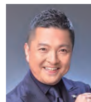
朝岡 聡 (ナビゲーター) Satoshi Asaoka

モーツァルト国際コンクールで日本人として初めて優勝。その後、ザルツブルク音楽祭のモーツァルト・マチネに出演する他国内外で活躍。2009、2018年にモーツァルトのピアノ・ソナタ全曲演奏会を行い好評を得た。CDはエイベックス・クラシックスとオクタヴィア・レコードよりリリース。第17回出光音楽賞受賞。