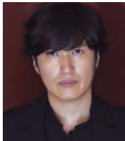
清塚 信也 (ピアノ) Shinya Kiyozuka