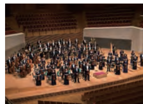
東京交響楽団 (管弦楽) Tokyo Symphony Orchestra

テレビ朝日アナウンサーとして活躍。フリーとなったからはクラシックコンサートの司会や企画構成にも活動のフィールドを広げ、芸術ファンのすそ野を広げる司会者として注目と信頼を集めている。