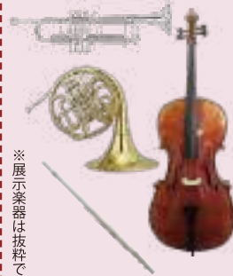
※展示楽器は抜粋です

喜歌劇「こうもり」のオーケストラ・ピットの雰囲気 会場に再現！実物の楽器の展示とともに 小澤征爾氏指揮によるハイライトシーンを放映。 弦楽器、木管楽器、金管楽器、打楽器 それぞれの聴きどころがわかる映像をお楽しみください。