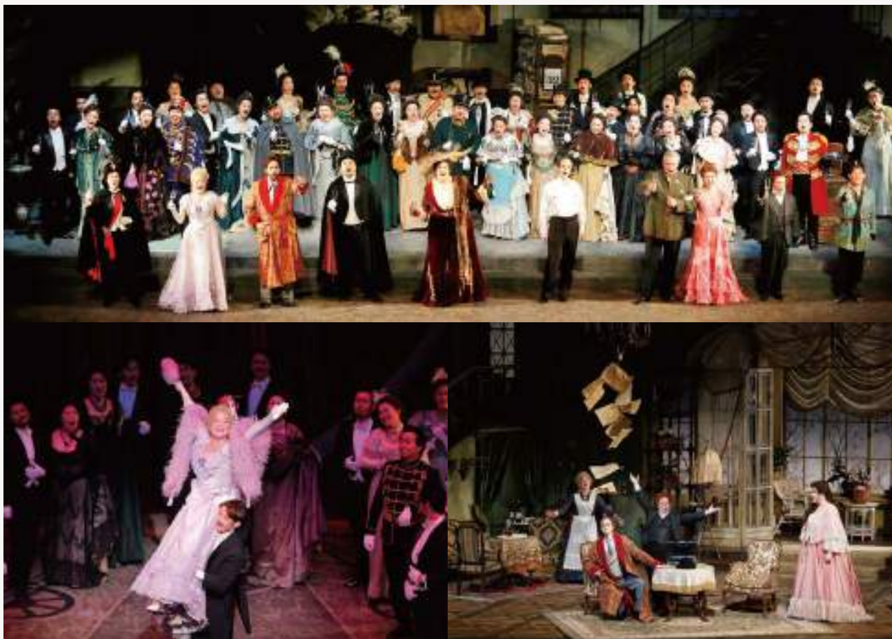
喜歌劇「こうもり」2016年公演

20年以上にわたる小澤征爾音楽塾のあゆみを振り返りながら、 喜歌劇「こうもり」の見どころを、オーケストラ・ピットに登場する 実物楽器の展示や過去映像とともにご紹介します。