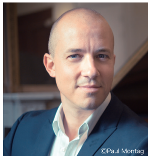
ジュリアン・ジェルネ(ピアノ)