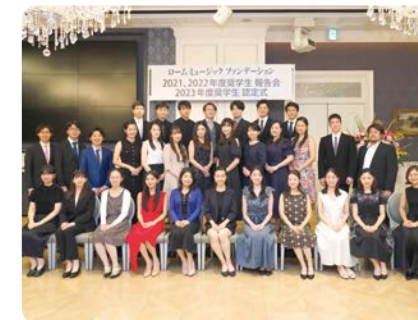
認定式・報告会(2023年)

奨学生に採択された方は、スカラシップ コンサートのほか、認定式・報告会、懇親会、アーティスト研修会などさまざまな行事にご参加いただくことができます。