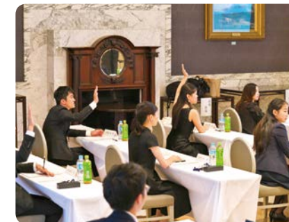
アーティスト研修会(2023年)