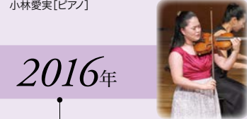
吉田南 [ヴァイオリン]