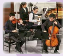
大江馨 [ヴァイオリン] 岡本侑也 [チェロ] 反田恭平 [ピアノ]