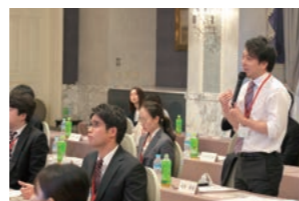
アーティスト研修会での質疑応答