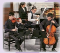
大江馨 [ヴァイオリン] 岡本侑也 [チェロ] 反田恭平 [ピアノ]