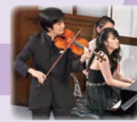
成田達輝 [ヴァイオリン] 萩原麻未 [ピアノ]